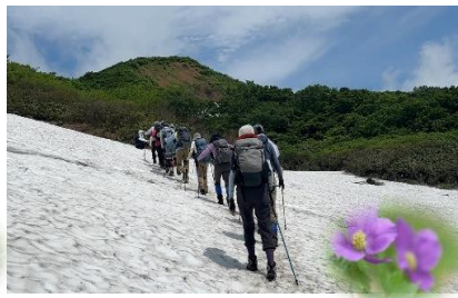
焼石岳を目指し雪溪を行く 日本二百名山 シラネアオイ