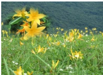
キスゲ平 ニッコウキスゲが満開