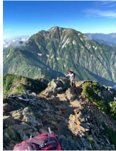
目標の唐松岳は 遥か～