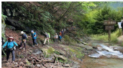
西沢渓谷…狭い渓谷・大展望台