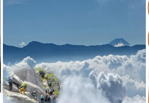
雲海にそびえる西農鳥岳と富士山 中ア・宝剣岳～空木岳