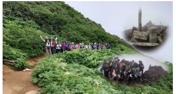
もう一度秋田駒ヶ岳へ!! 花の百名山、日本二百名山