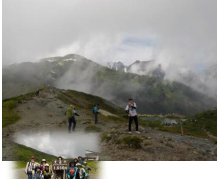
北ア・八方池と白馬岳