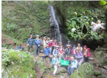
御岳山・綾広の滝 レンゲショウマ