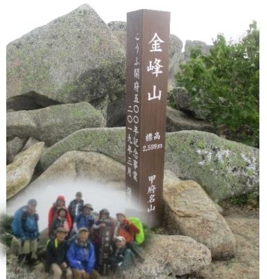
雨上がり後の金峰山頂上