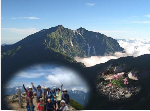
北ア・鹿島槍ヶ岳 コマクサ