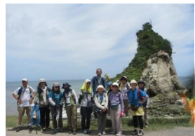
ふれ合いの道九十九里 雀島 スカシユリ