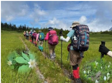
北ア・風吹大池 足元にはワタスゲ キヌガサソウ、ミズバショウ