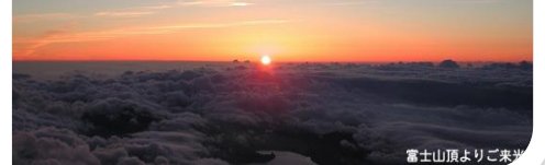
富士山頂よりご来光