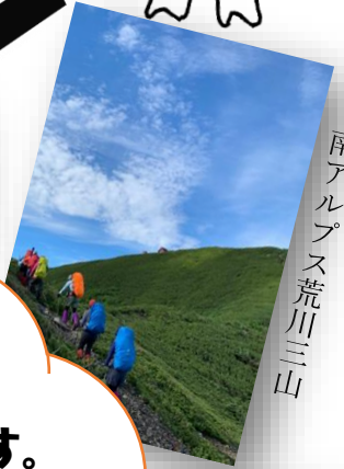
南アルプス荒川三山