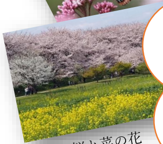
幸手権現堂桜と菜の花